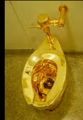
• Maurizio Cattelan, Toilet