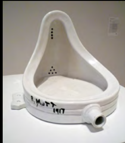
• Marcel Duchamp, Fontaine