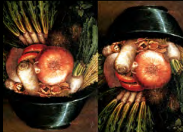
• Giuseppe Arcimboldo , L'ortolano (Le Jardinier)