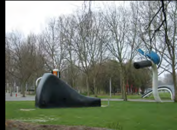
• Claes Oldenburg et Coosje Van Bruggen , La bicyclette ensevelie , 1990