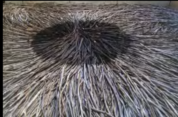
• Andy Goldsworthy , Burnt patch https://www.goldsworthy.cc.gla.ac.uk/