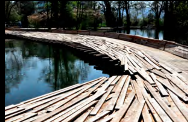
• Tadashi Kawamata , Zellweger park http://www.tdashikawamata.com/Caillou