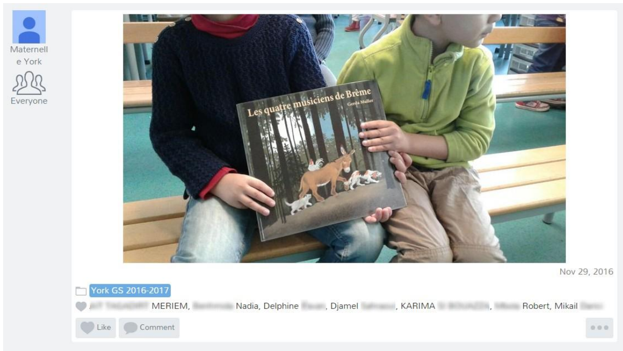
La photo d'un album étudié collectivement en classe est diffusée à l'ensemble des parents. Chacun peut ainsi en parler rapidement avec ses parents.