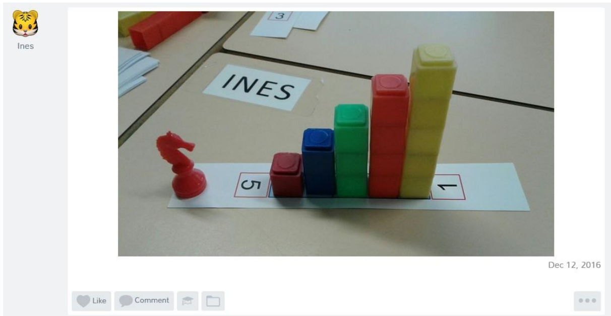
Photo prise à l'issue d'un atelier de résolution de problème. Ines peut parler de cet atelier avec ses parents quelques heures plus tard.